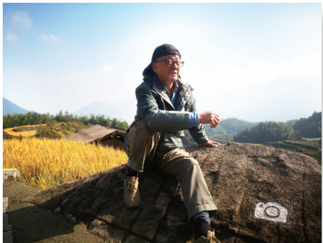
■ 晚报记者 王卫国