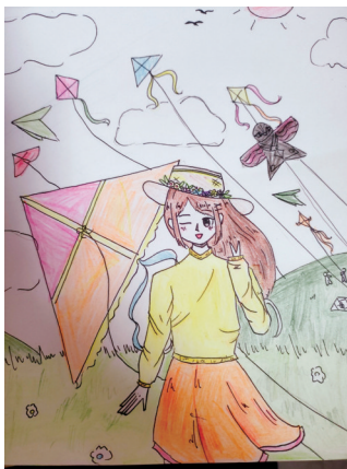
N 实验中学教育集团711班 曹思涵 指导老师 宣春霞