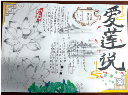
N 实验中学教育集团804班 陶子馨 指导老师 徐丹琴