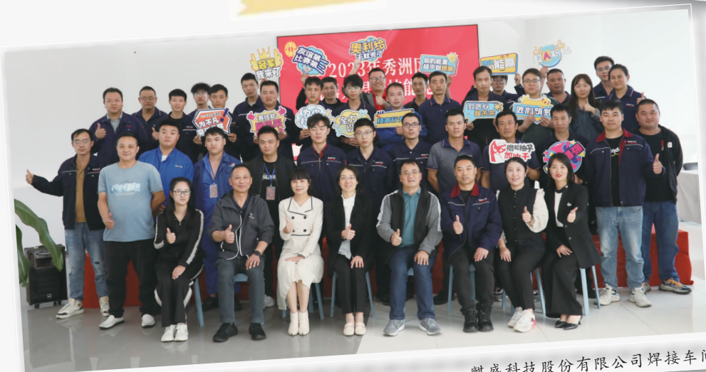
麒盛科技股份有限公司焊接车间