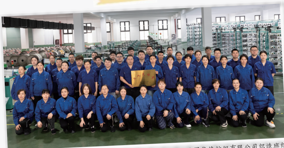
海宁经编园华纬纺织有限公司织造班组

截至目前，嘉兴共有各级劳模1276人，其中国家级劳模77人、省部级劳模508人、市级劳模691人。市总工会相关负责人表示，下一步将持续深化“工匠之城”建设，紧扣全市“十五五”发展目标，不断完善产业工人培育、使用、评价、激励机制，做强工匠学院体系，丰富技能竞赛载体，优化礼遇保障服务，全力打造技能人才成长沃土，让更多职工成长为工匠，在嘉兴成就梦想，以匠心赋能高质量发展，奋力书写红船旁工运事业新篇章。