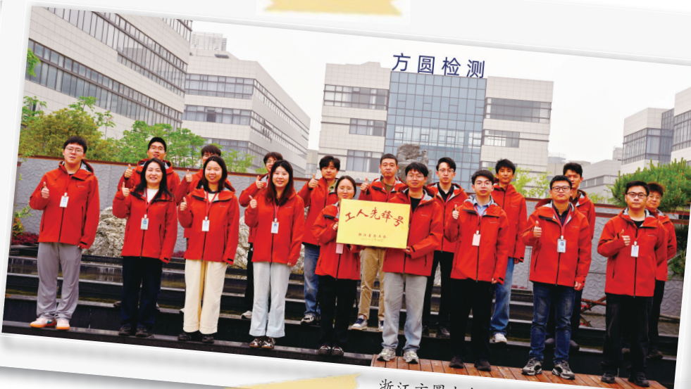
浙江方圆电气设备检测有限公司检测部