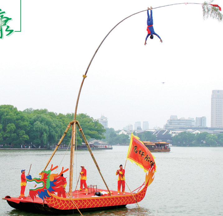
高杆绝技在南湖