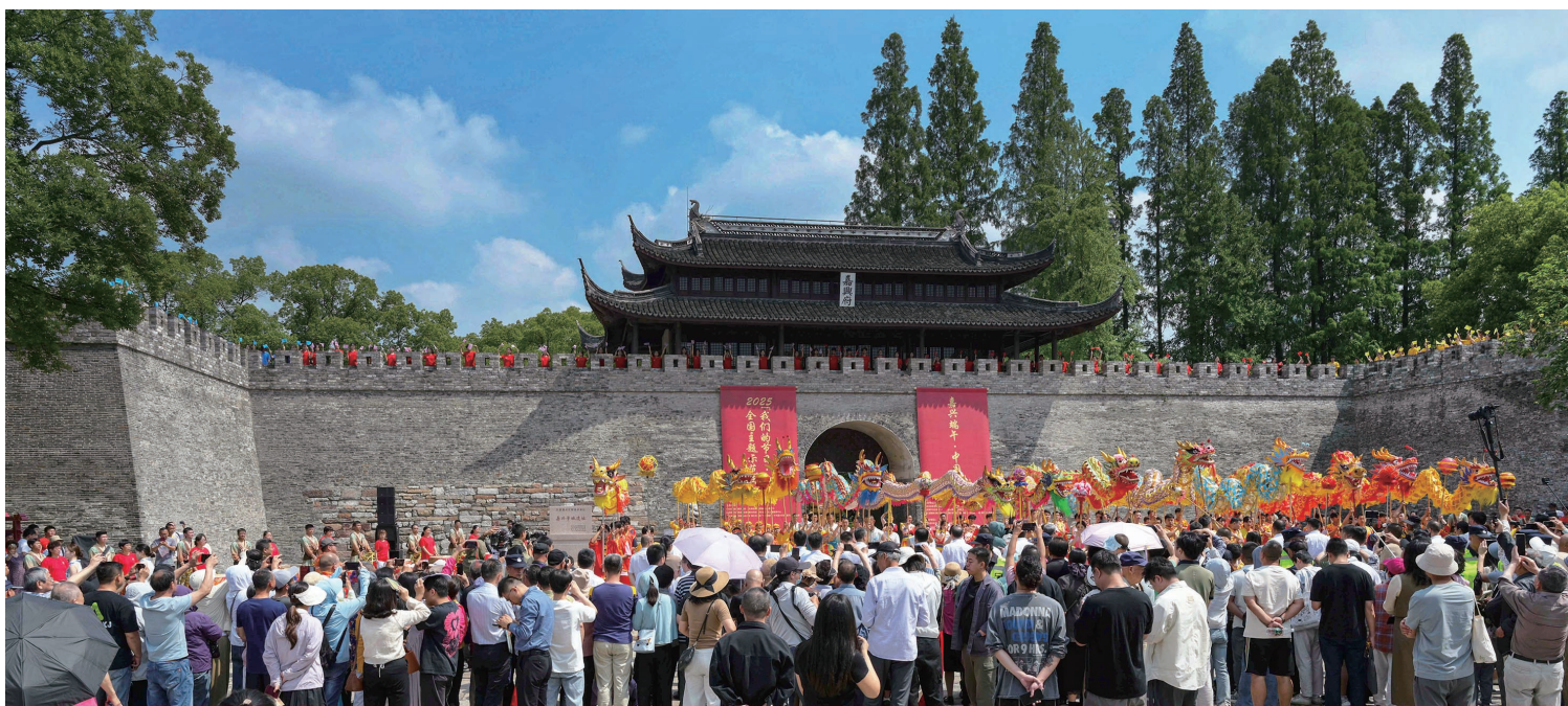
子城舞龙庆端午 作者:张春莲 端午佳节,子城广场上龙舞翩跹,锣鼓铿锵。市民齐聚赏非遗,领略禾城传统民俗风采。

本版是嘉兴广大摄影爱好者的作品展示舞台,不管你是用相机还是手机,只要作品足够精彩、有趣,就有机会刊登在版面上。请关注晚报各融媒端口,我们也将邀请优质作者加入晚报相关社群,我们将定期发布征稿主题,同时,也欢迎广大读者自由来稿。