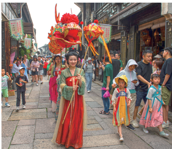
古街端午行

这组影像,献给每一位在嘉兴共度端午的人。愿你透过画面嗅得清甜粽香、听得震天鼓点,邂逅家乡最动人的烟火;愿你岁岁同舟相伴,年年平安顺遂。