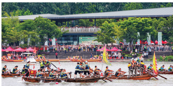
踏白船表演赛 作者:董静 2026年6月19日摄于西南湖。