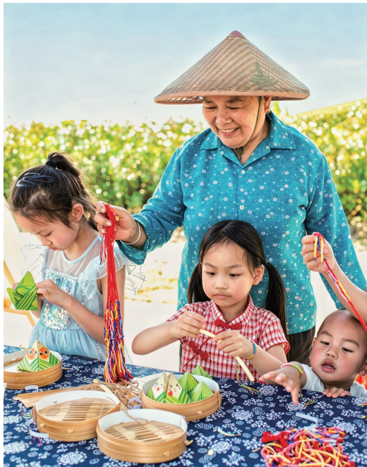
奶奶授艺制香裹 作者:林坚强