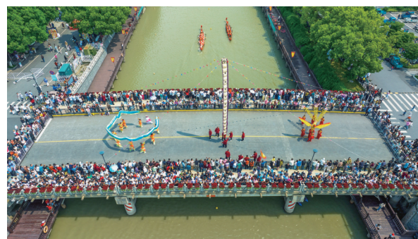
桥上桥下

海宁长安镇举办龙舟比赛,桥下龙舟你追我赶,桥上民俗表演如火如荼,一场氛围感满满的端午民俗盛宴呈现在观众眼前。