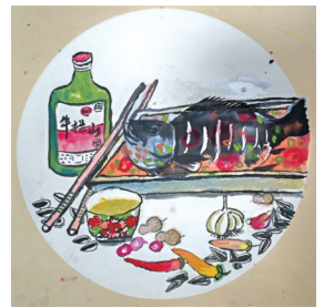
N 四(3)班 蒋欣雨 指导老师 蒋雪华

愿全体同学永葆阅读热忱,在书页间汲取力量,在文字里涵养品格,把阅读的爱,变成探索世界与书写成长的底气,让书香伴随成长,让文字点亮未来。