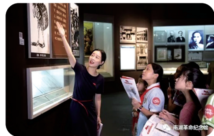
本版图片均为资料图片

一座馆,见证百年党史;一座城,几代人守护同一份初心。这份情感,像南湖的水一样,静静流淌,永远不会干涸。