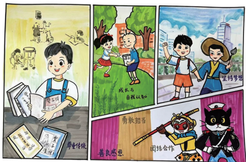
《争当新时代好少年》