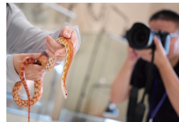
以“异宠+乡村振兴”出圈的万田乡下蒋村。