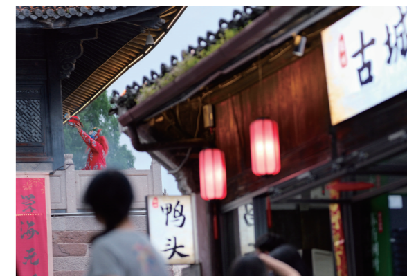
衢州古城的情景剧演出。