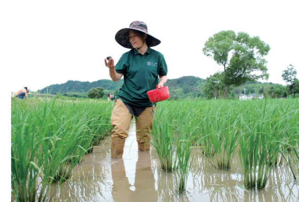
一亩耘心的“稻螺共生”产业。