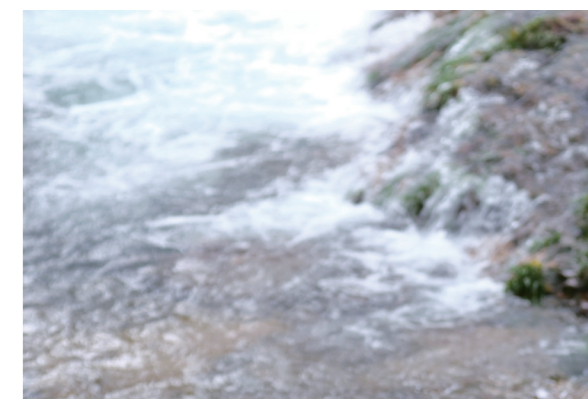
一名男子躺在溪边玩手机。