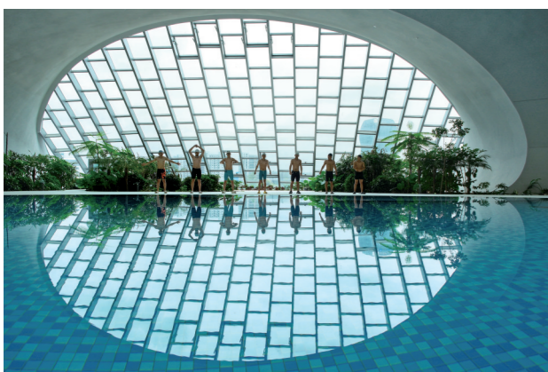
游泳运动员正在进行热身。