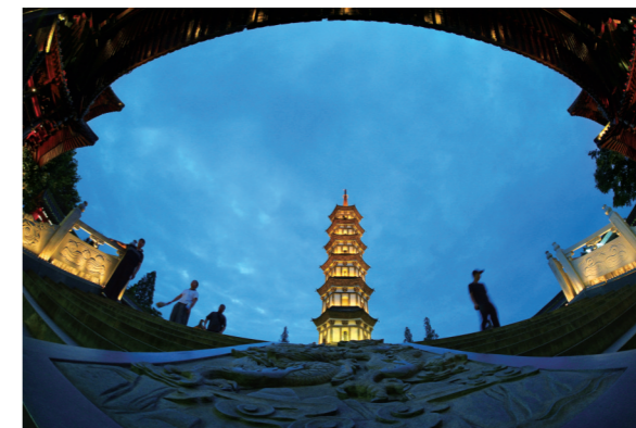
入夜,衢州古城里的天王塔亮灯。