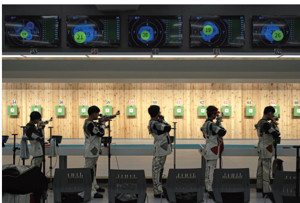
在灵鹫山射击中心训练的少年。

此次采访与交流活动为全省新闻摄影记者搭建起互学互鉴、切磋交流的平台。现场还对采访作品进行分析评比,专家作现场点评,参会记者分享拍摄心得、研讨实操技巧,在思维碰撞中实现业务能力共同提升。