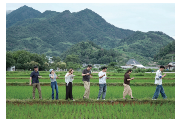
摄影记者在在田间用餐,享受大自然的气息。