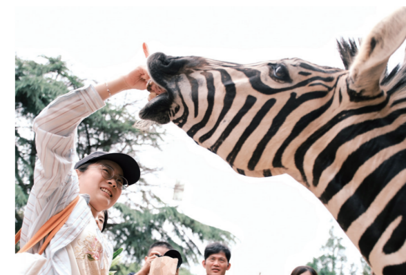
在下蒋村栖息岭,游客正在投喂斑马。