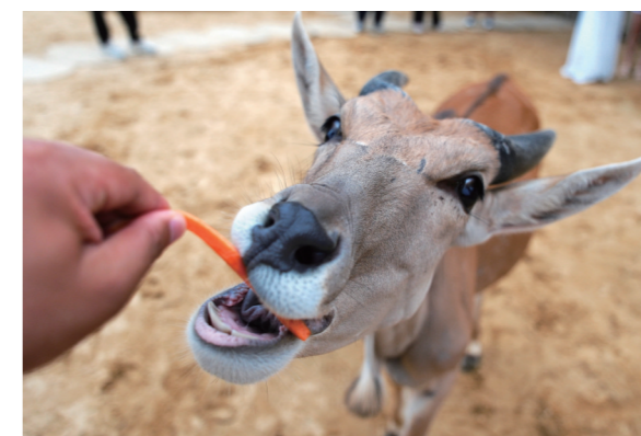
在下蒋村栖息岭,游客正在投喂羚羊。