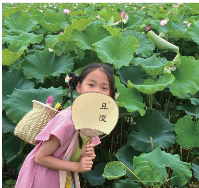
荷田小背篓 作者:顾敬瑜

荷花不言,却盛得下所有人的欢喜。它是一面镜子,照见城市生态的底色,更照见生活在此处的人们内心深处的柔软与丰盈。愿这一帧帧荷影,也让你觉得,生活在这座城里,真好。