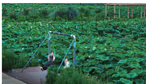
休闲时光 摄于王江泾千亩荷田。一对母女在荷田边荡秋千,很惬意,尽享生活之美。