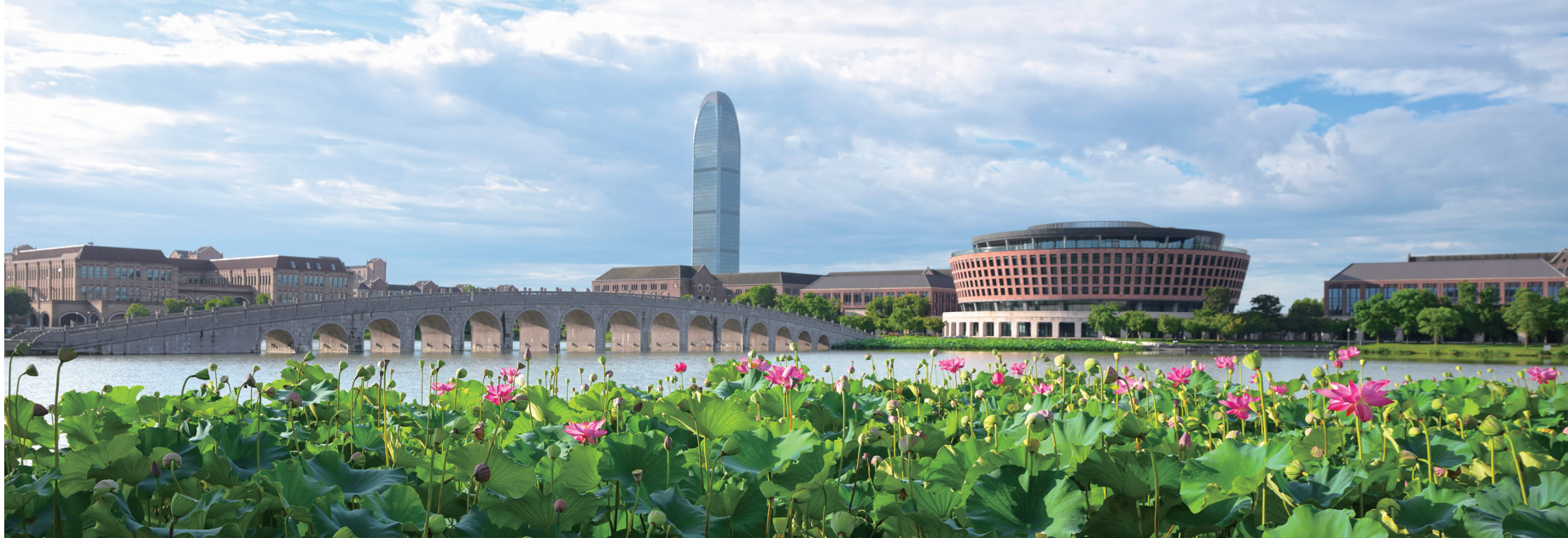
荷韵浙大 作者:顾月良 7月6日清晨,在荷花的映衬下,浙江大学海宁国际校区更显大气美丽。