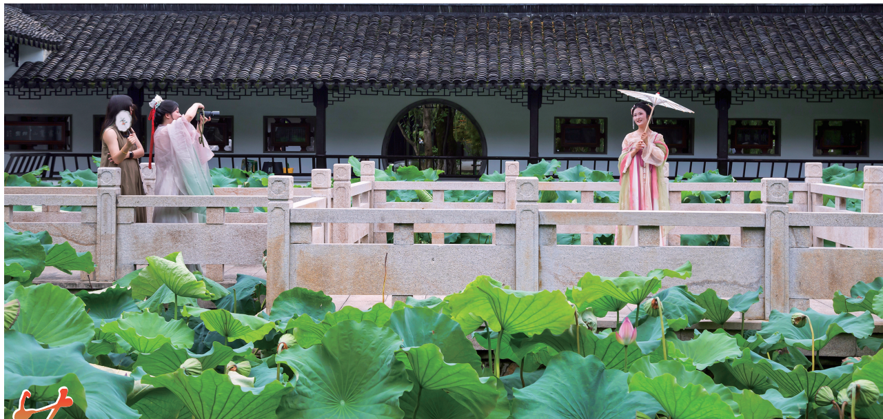
荷园留影 作者:董静 摄于嘉兴揽秀园。

投稿邮箱为 nanhuwanbaozg@163.com,请注明作品标题、姓名、联系电话和地址,如有创作过程自述更佳。