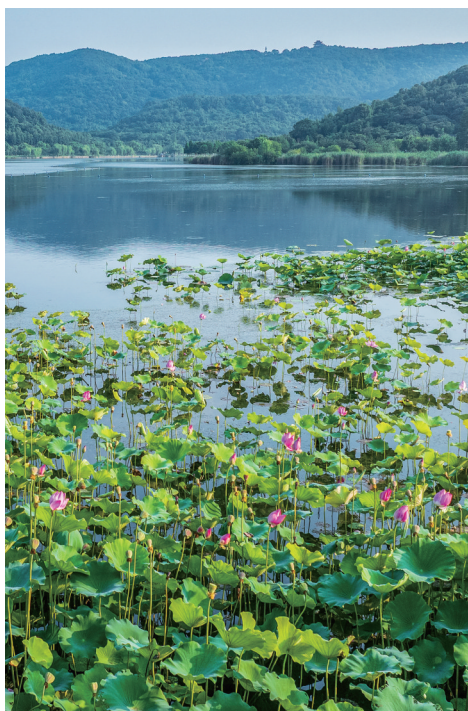
一湖晴翠映莲开 作者:林坚强 6月28日,海盐南北湖北里湖青峦环碧,近水铺荷,宛如一幅精致的山水画。

本版是嘉兴广大摄影爱好者的作品展示舞台,不管你是用相机还是手机,只要作品足够精彩、有趣好玩,就有机会刊登在版面上。请关注晚报各融媒端口,我们也将邀请优质作者加入晚报相关社群,我们将定期发布征稿主题,同时,也欢迎广大读者自由来稿。