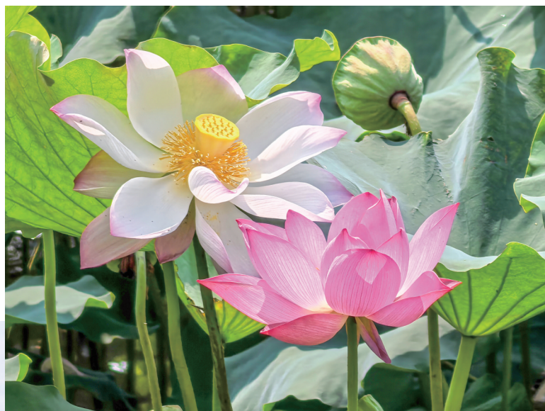
双荷并芳 作者:姚士桐 6月26日摄于海宁。