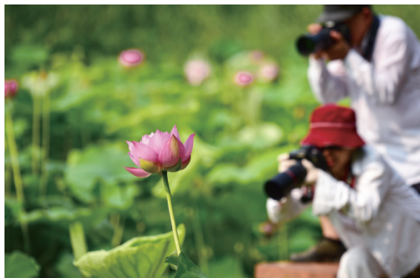
荷间快门声 作者:范家驹 拍摄于嘉兴植物园。