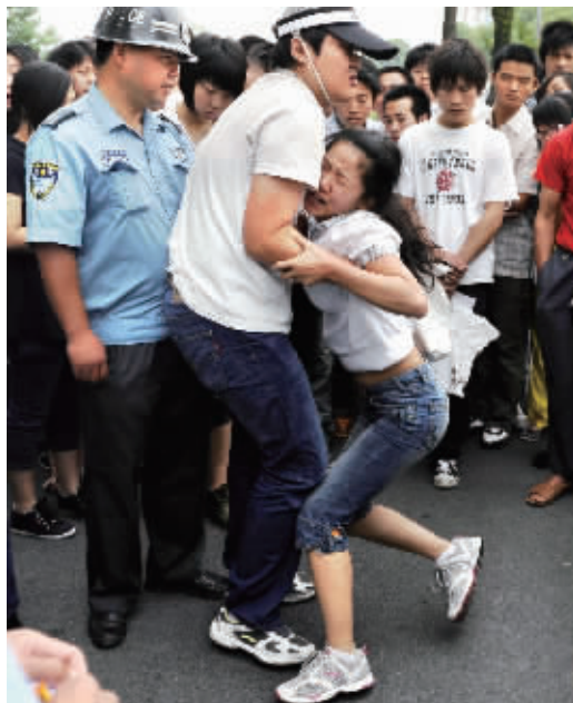
随后拖着女子离去