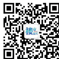
微信公众号二维码

聚焦楼市热点，传递楼市动态，关注市场冷暖。《楼市嘉兴》，做禾城百姓喜爱的楼市资讯。