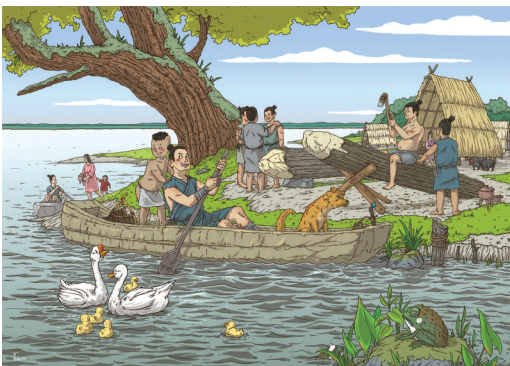
《远古的回想——纪念南河浜遗址发掘30周年》 刘可