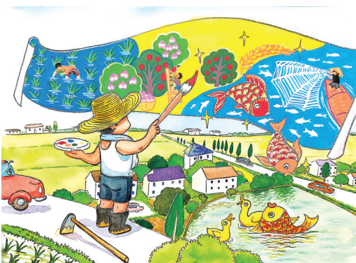
《嘉兴美丽乡村画中来》 陈春娜