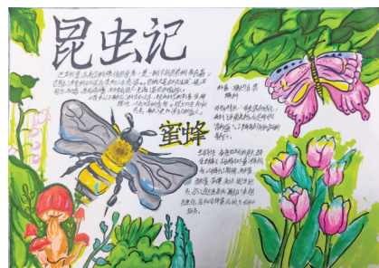
N 804班 顾缘溪 指导老师 徐丹琴

日出象征着新生与希望，象征着勇气与激情。它是自然界赠予的无价之宝，让我们追随日出的脚步，以热情与朝气迎接每一个充满挑战的日子！