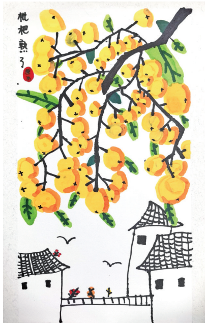
枇杷熟了 N103班 万可欣

伴着淅淅沥沥的春雨，经过十几分钟的车程，我们抵达了烈士陵园。下了车，我们撑着伞排好队，门口青松翠柏让原本喧闹的我们瞬间安静下来，冷雨浸润着空气，静谧又肃穆，细雨打在伞上的沙沙声格外清晰。没走多远，一块刻着英雄雕像的革命烈士纪念碑矗立眼前，雨水轻轻落在雕像上，仿佛为英雄披上了一层薄纱。仪式开始了，我们整齐列队，高唱国歌，