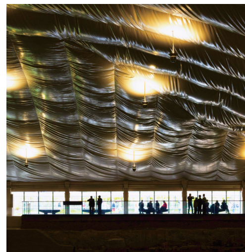
光景为幕(中) 作者:郝建胜