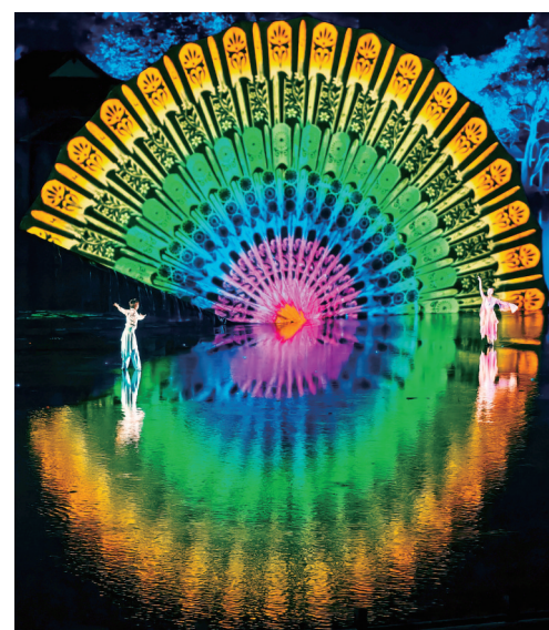
孔雀开屏(下) 作者:郝正言

晚报《爱拍》专版是为嘉兴广大摄影爱好者搭建的展示作品的舞台,不管你是用相机还是用手机,只要你拍的照片画面精彩、有趣好玩,就有机会刊登在版面上,并得到专业人士的点评。你也可以将更多的作品上传到读嘉新闻客户端“嘉友圈”的“爱拍”频道(扫二维码),和更多的同道中人进行交流。 晚报《爱拍》专版投稿邮箱为359974392@qq.com,请注明照片标题、作者自述以及作者姓名、联系电话和地址。