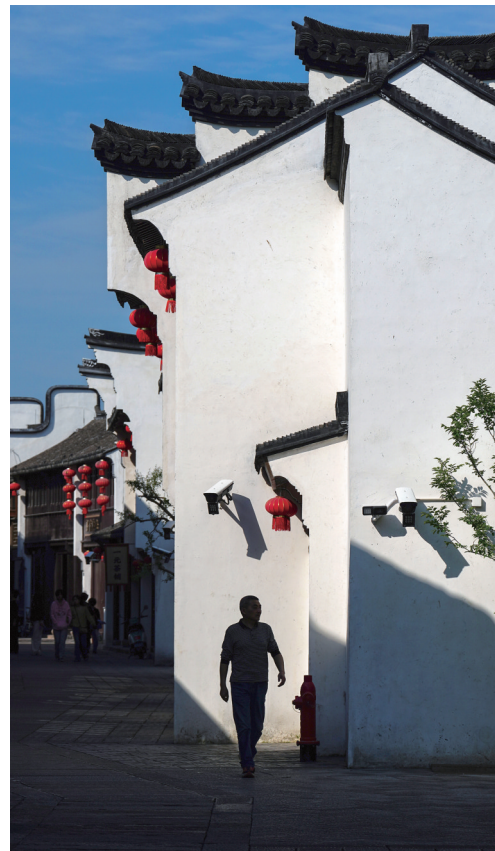
屋檐下(上) 作者:羊正