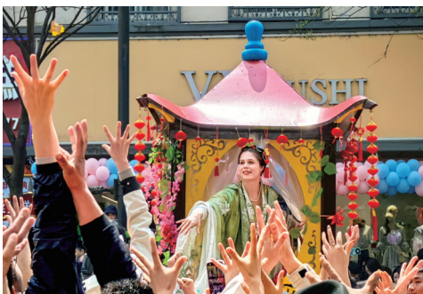
蚕花节庆、彩舆同乐

点评:进入繁殖期的白鹭,长出惊艳的婚羽(繁殖羽),羽姿宛如绽放的烟花,灵动富有生机。作者巧用侧逆光,细腻勾勒白鹭飘逸的羽毛。深绿色虚化背景被压成近乎纯黑暗调,与自带光晕的白鹭形成鲜明明暗对比,极大突出画面主体。