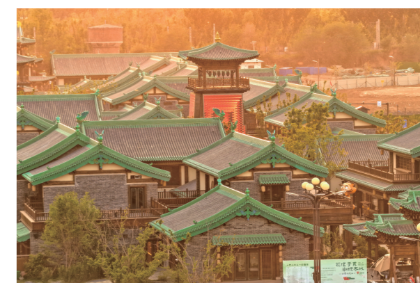
如今，山君水院已成为区域消费新引擎，吸引了周边地区的游客前往。