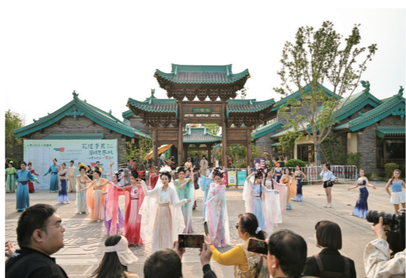
今年“五一”假期，山君水院推出各类沉浸式国风文旅活动。