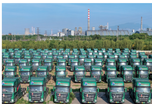
鹏飞智创汽车制造产业园生产的氢能车辆源源不断走向市场。