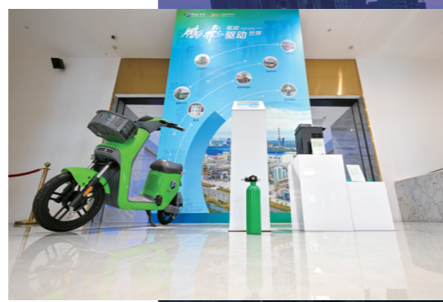
鹏飞集团总部展示氢能电动自行车。