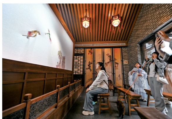
游客们在山君水院欣赏非遗皮影戏表演。