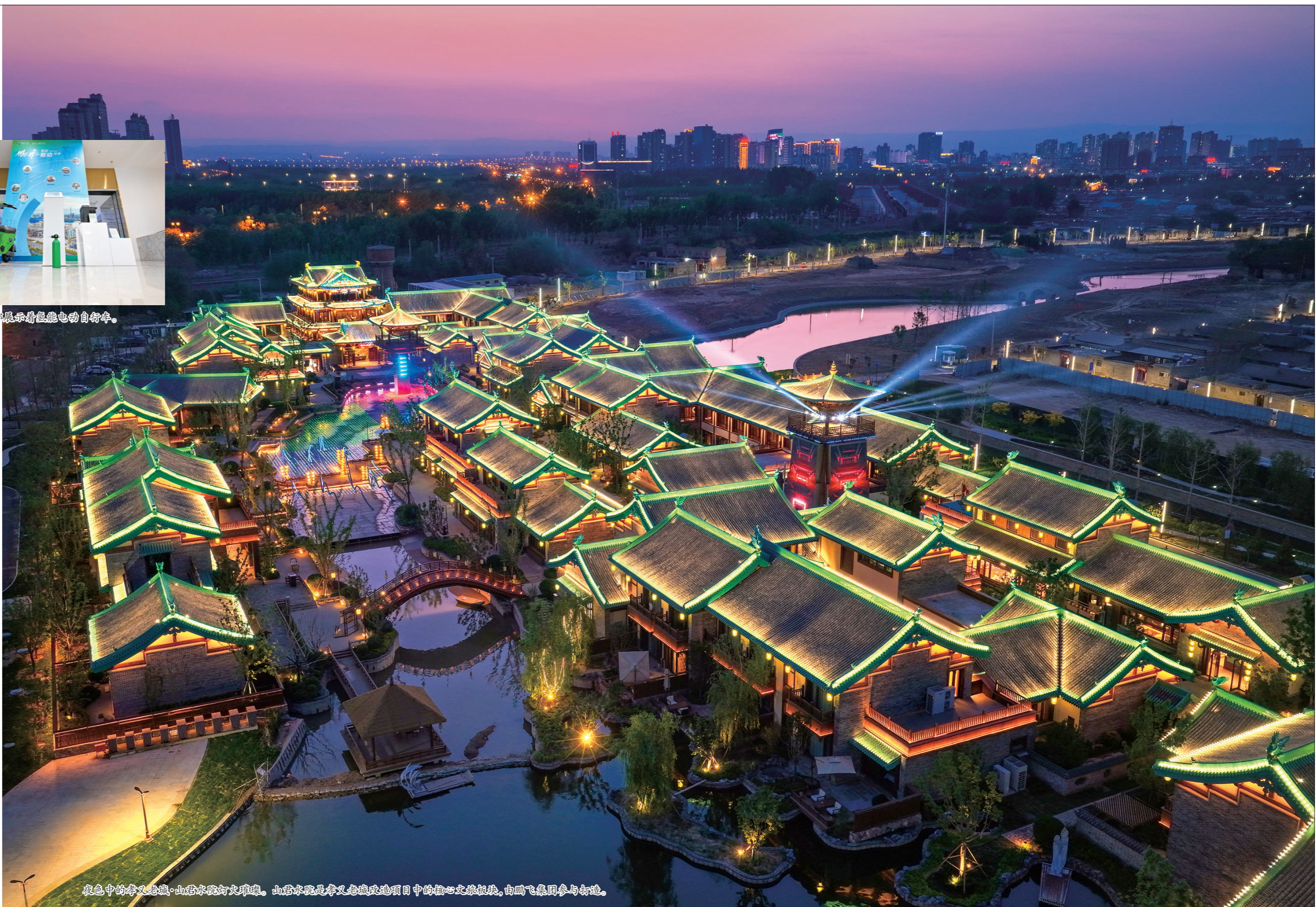
夜色中的孝义老城·山君水院灯火璀璨。山君水院是孝义老城改造项目中的核心文旅板块，由鹏飞集团参与打造。