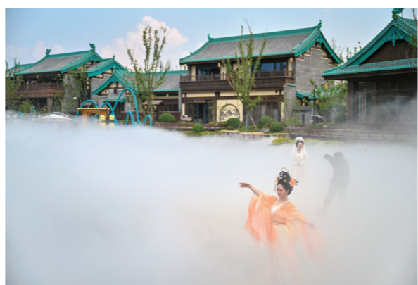
演员在山君水院翩翩起舞。