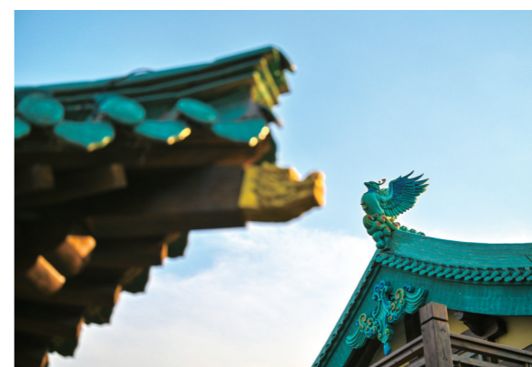
孝义老城·山君水院的建筑设计别具一格。