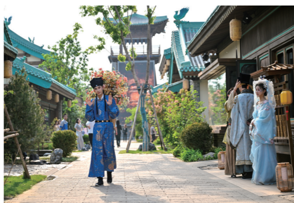
山君水院，国风巡游。