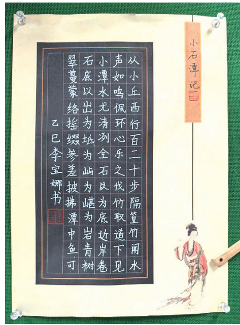
N302班 李宝娜 指导老师 陈越哲