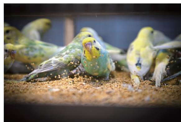
直播间里,鸚鵡的模样吸引着人们前来选购。