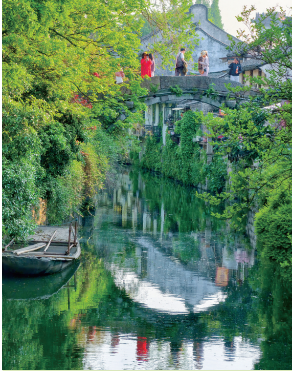
初夏 作者: 陈宗强

作者自述: 很多人不喜欢夏天, 同时夏天的炽热高温也会让很多绿植失去活力, 但荷花不怕, 反而太阳越大, 气温越高, 荷花会生长得越好, 你瞧初夏的到来让碗莲茁壮成长, 亭亭玉立!