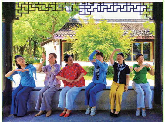
群芳亭语 作者: 沈煌

作者自述: 南湖勺园休憩的靓女们, 正用各种手语表达着对初夏时节的感慨和生活感悟, 加上各自的五彩时装, 便赋予了画面更多的故事, 我不由得用手机定格下来。