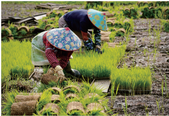
浅夏新秧绿 作者: 羊下

本版是嘉兴广大摄影爱好者的作品展示舞台, 不管你是用相机还是手机, 只要作品足够精彩、有趣好玩, 就有机会刊登在版面上。请关注晚报各融媒端口, 我们也将邀请优质作者加入晚报相关社群, 我们将定期发布征稿主题, 同时, 也欢迎广大读者自由来稿。下期主题为“毕业季”。