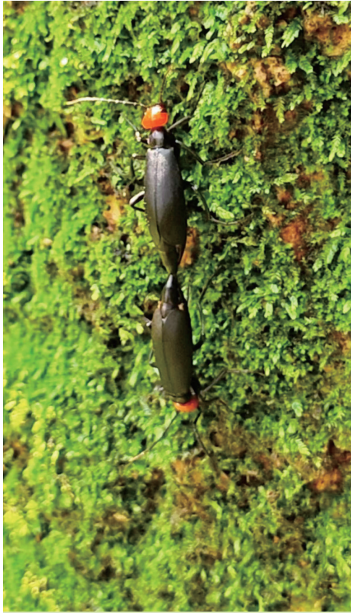
动物世界里的芒种 作者: 袁培培