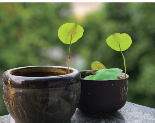
阳台上的初夏 作者: 陶国民

作者自述: 很多人不喜欢夏天, 同时夏天的炽热高温也会让很多绿植失去活力, 但荷花不怕, 反而太阳越大, 气温越高, 荷花会生长得越好, 你瞧初夏的到来让碗莲茁壮成长, 亭亭玉立!