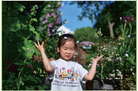
初夏的暖风 作者: 姚艳频