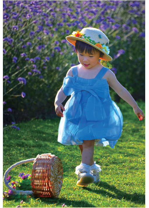
花海萌娃 作者: 姚建雄

投稿邮箱为 nanhuwanbaozg@163.com, 请注明作品标题、姓名、联系电话和地址, 如有创作过程自述更佳。