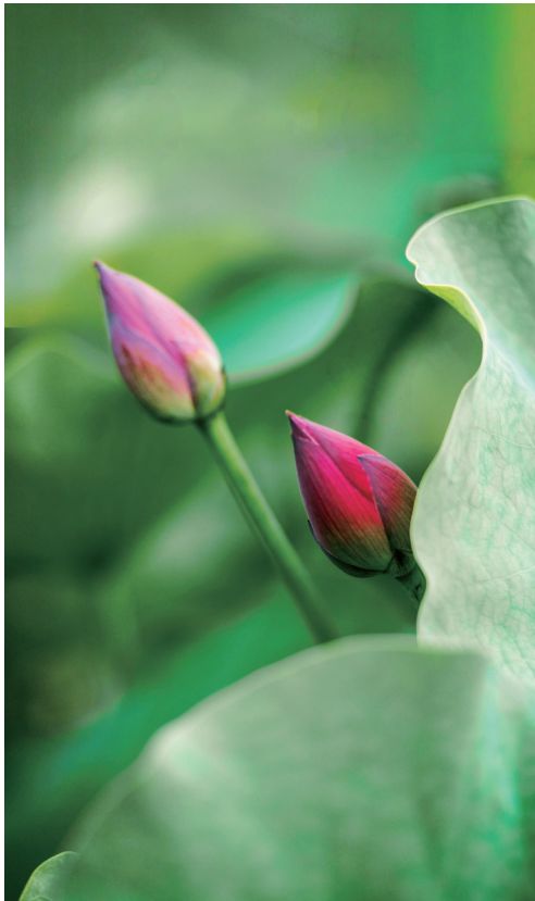
荷苞含香入夏来 作者: 林坚强